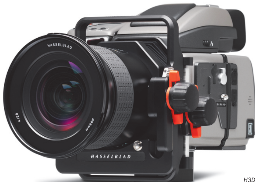
H3DII mit HTS 1.5 Tilt-/Shift-Konverter und HCD 28 mm Objektiv

Bitte beachten Sie bei Bedarf die Bedienungsanleitung für Fachkameras.